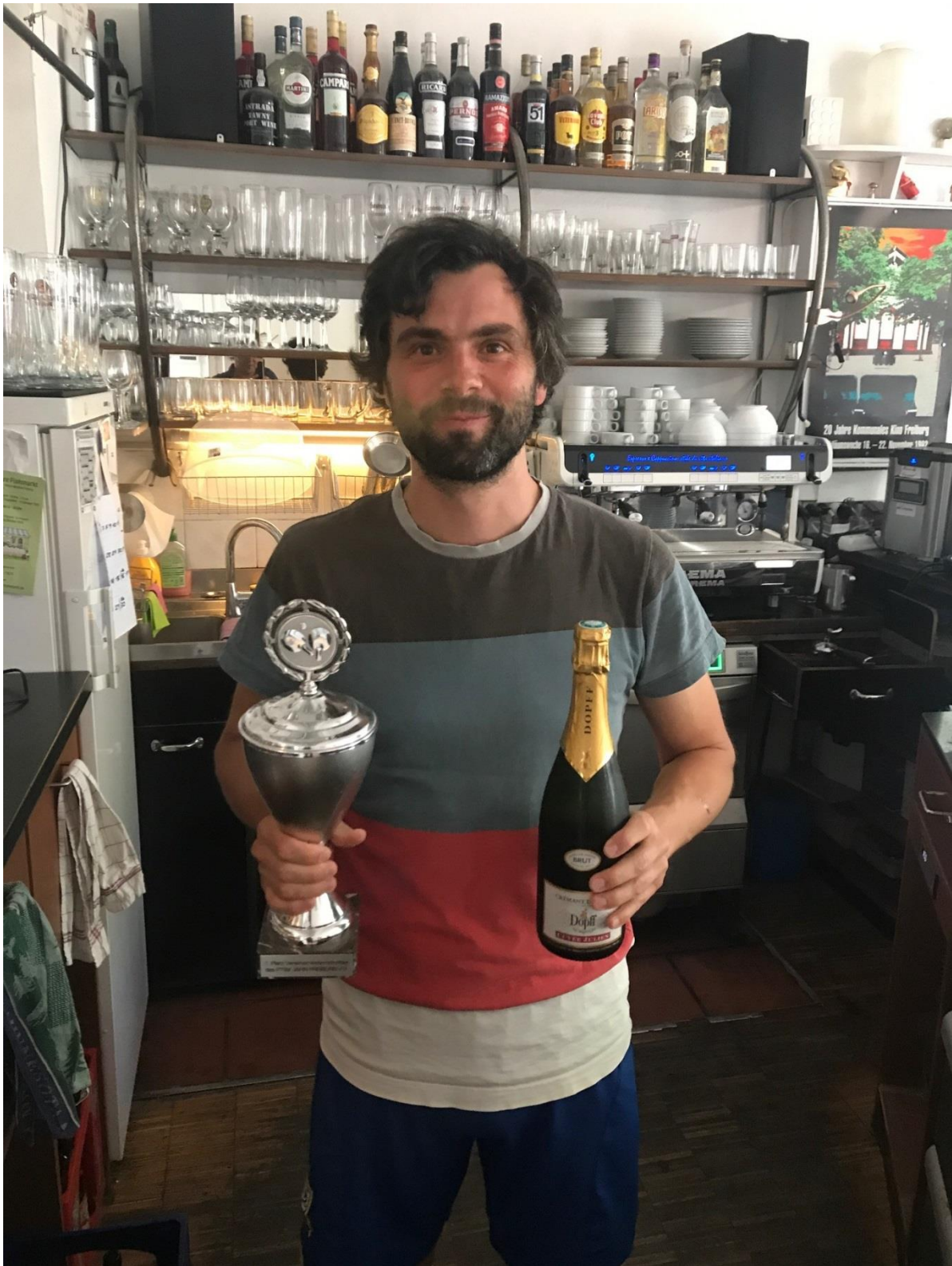
Die Übergabe des Wanderpokals fand aufgrund der gegebenen Umstände zwei Tage nach dem Turnier statt